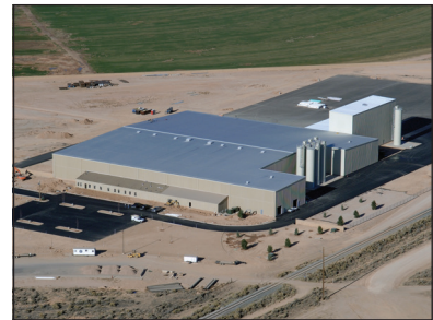
Cedar City, Utah