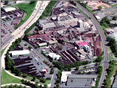
Charlotte, North Carolina