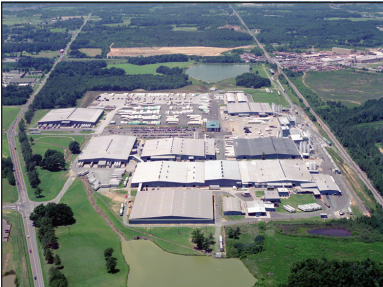
Monroe, North Carolina